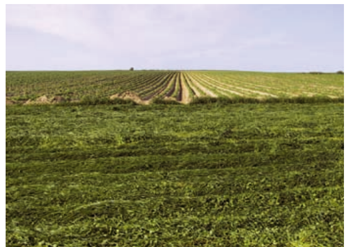
Enrubannage sur un bout de champ enherbé à base de ray-grass et de trèfle