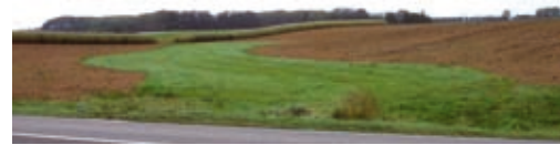
Le rayage doit atteindre la zone enherbée...