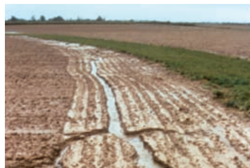
...sinon une rigole se creuse !