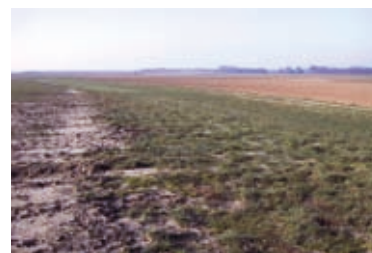
Terre piégée par une fourrière enherbée