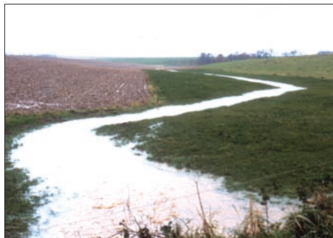
L'enherbement du talweg doit être assez large pour permettre aux écoulements de divaguer entre les zones de dépôts

Si vous avez repéré la largeur de l'écoulement lors d'une crue, enherbez au minimum sur la largeur de l'écoulement observé !